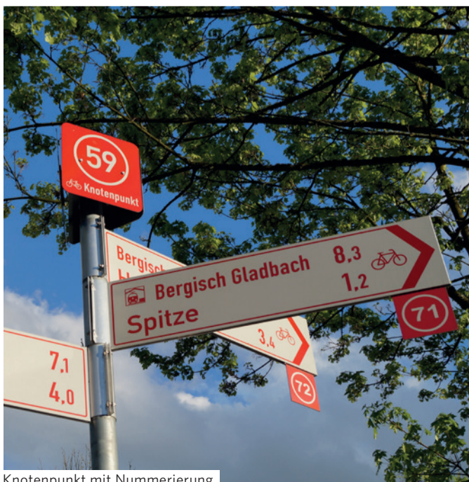
Knotenpunkt mit Nummerierung

Genießen Sie auf Ihrer Tour durch den Naturpark Bergisches Land eine Mischung aus urbanem Flair und natürlicher Schönheit. Begeben Sie sich auf Entdeckungsreise!