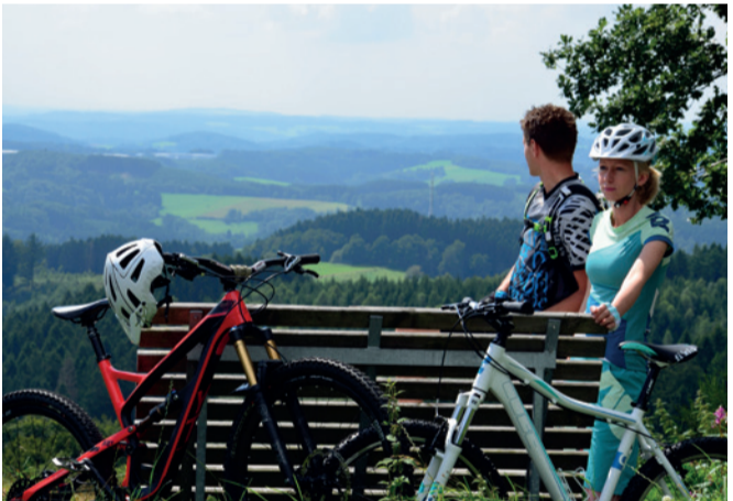
1. Auflage 2017

Sie haben Rückmeldungen zur Qualität der Wege? Dann nehmen Sie bitte Kontakt mit uns auf: